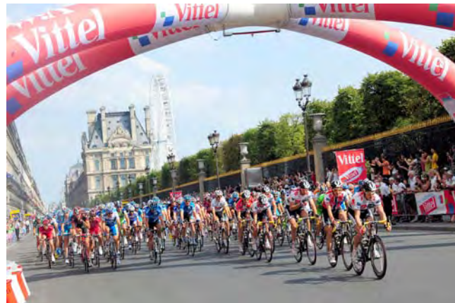
Les coureurs du Tour de France lors du passage sous la flamme rouge, rue de Rivoli.

Henri IV impose à Paris un siège de cinq mois, de mai à septembre 1590, qui fait 45 000 morts