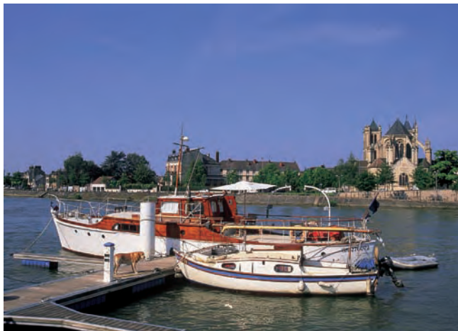
La Collégiale Notre-Dame vue des bords de l'Yonne

Le projet prévoit en outre la construction de petits logements collectifs ou individuels. Une maison des services publics, un centre commercial, des équipements publics, notamment scolaires, viennent compléter le programme.