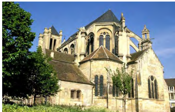
Collégiale Notre Dame et Saint Loup

La méfiance règne en cet après-midi de fin d'été. Des rumeurs d'assassinat planent des deux côtés et des enclos ont été bâtis à chaque extrémité du pont pour cantonner chacun des contingents qui se font face. Jean Sans Peur s'avance enfin, sans escorte, pour mettre le Dauphin en confiance. Charles le rejoint, accompagné de dix hommes. Le Duc s'agenouille