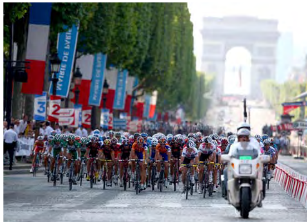
Le peloton sur les pavés des Champs-Élysées en 2008

Cette course aux sommets ne s'arrête pas là. Annoncée pour 2012, la Tour Phare, conçue par l'architecte américain Thom Mayne, viendra titiller la Tour Eiffel à 300 mètres de hauteur. C'est pourtant la Tour Generali qui devrait s'imposer sur le fil : installée à la place de l'immeuble Iris, cette tour « écologique » devrait atteindre 318 mètres à l'horizon 2012.