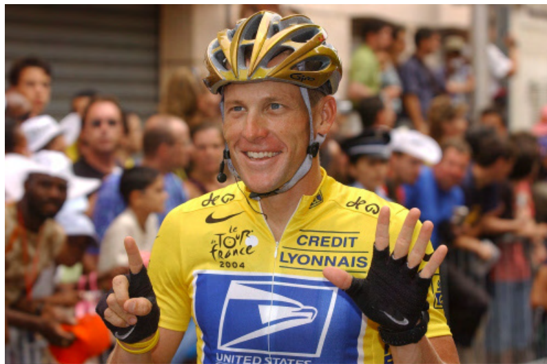
Lance Armstrong lors du départ de la dernière étape du Tour de France 2004 à Montereau

En 1977, c'est le regretté Néerlandais Gerrie Knetemann qui avait enlevé à Versailles la troisième de ses dix victoires d'étape sur le Tour alors que Bernard Thévenet s'imposait au général.