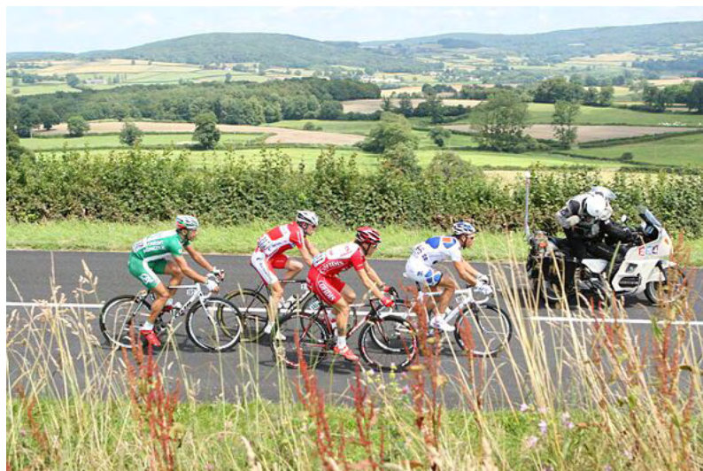
Sylvain Chavanel, Philippe Gilbert, Gianpaolo Cheula et William Bonnet lors d'une échappée sur les routes de l'Yonne

La ville de Tonnerre n'avait encore jamais accueilli le Tour de France. Ce sera donc une grande première. Le département de l'Yonne, en revanche, a souvent reçu les champions de la petite reine. À l'occasion du Tour, bien sûr mais aussi parce qu'il est idéalement situé sur la diagonale de Paris-Nice. Sens, Joigny, Avallon et Auxerre ont eu l'occasion de figurer sur le parcours de la première grande course à étapes de la saison. Le Tour de l'Avenir 2008 a, quant à lui, fait étape à Avallon et à Vézelay.