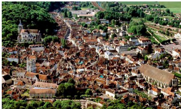
Tonnerre vue du ciel