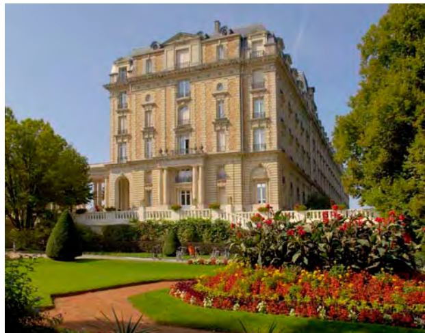
Le Grand Hôtel - Photo : Vittel Congrès Tourisme

Vittel peut s'appuyer sur six pôles complémentaires pour assurer son développement économique : le Club Med, principal opérateur touristique de Vittel, Nestlé Waters et ses 1500 salariés, le Casino, les Thermes et le Spa, le CPO (centre de préparation omnisports) et le Palais des Congrès.