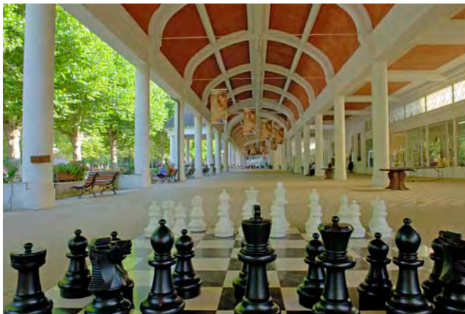
Vue de la galerie thermale

Les qualités de l'eau de Vittel sont connues depuis les Romains, qui exploitaient déjà des thermes dans la station des Vosges. Mais lorsque Louis Bouloumié vient en cure, la vogue du thermalisme, venue de Bath et de l'Angleterre bat son plein. Il rachète la source de Gérémy et a l'idée simple, mais géniale, d'embouteiller son eau pour la commercialiser et pour pouvoir poursuivre la cure de retour chez lui. C'est le début d'une extraordinaire aventure industrielle, mais aussi architecturale, qui transforme la ville en un lieu de villégiature exceptionnel posé dans un écrin de verdure et de nature préservées. Quatre générations de Bouloumié veilleront à la prospérité de l'entreprise, mais aussi et surtout à l'aménagement de la station thermale. Les plus grands architectes de leur temps ont ainsi donné à la ville son cachet unique.